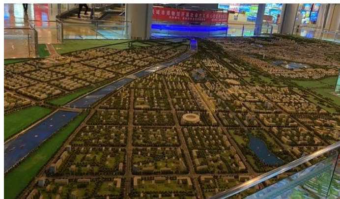
Zdjęcie 10. Makieta miasta Jiayuguan e Muzeum Miasta Jiayuguan.

Oprócz żywności, miasto musi mieć też dostęp do prądu. Program zwiedzania obejmował bazę chińskiej firmy Jiangxi Iron & Steel Co., zajmującej się produkcją stali o nazwie „ Smart Grid and Localized New Energy Consumption Demonstration Project Base ”. Projekt ten integruje odnawialne źródła energii, głównie fotowoltaiczne, z siecią energetyczną w celu zaspokojenia potrzeb przemysłowych, zmniejszając emisje CO2 (dwutlenku węgla). Część wytworzonej energii jest przeznaczona dla mieszkańców miasta.