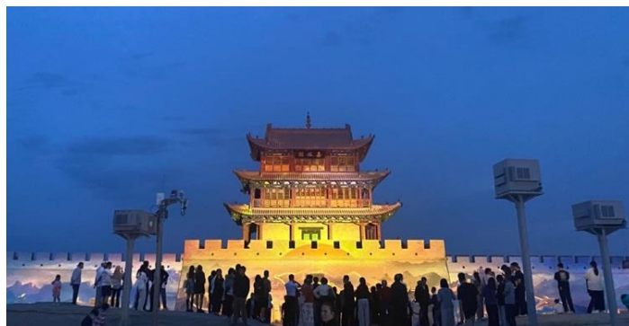
Zdjęcie 9. Wejście do forticy Jiayuguan.

Do Jiayuguan – dumy regionu wpisanej na listę UNESCO – dotarliśmy szybką koleją. Jest on zbudowanym na pustyni, nowoczesnym miastem przemysłowo-turystycznym. O jego historii i rozwoju na przestrzeni ostatnich dziesięcioleci dowiedzieliśmy się podczas wizyty w muzeum Jiayuguan City. Do najważniejszych zabytków tego miasta należy Forteca Jiayuguan z dynastii Ming, która stanowi zachodni kraniec Wielkiego Muru Chińskiego. Znajduje się ona na pustyni Gobi rozpościerającej się na około 1,3 milionów kilometrów kwadratowych. Delegacja naszego Stowarzyszenia uczestniczyła w wieczornym pokazie multimedialnym na świeżym powietrzu. Co ciekawe, historia tego zabytku była wyświetlana jako animacja bezpośrednio na odrestaurowanych murach budowli. Wymieniona forteca miała duże znaczenie strategiczne jako przejście na Jedwabnym Szlaku, a dzisiaj stanowi przykład nowoczesnej turystyki.