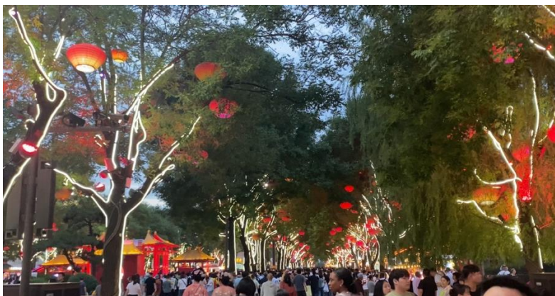
Zdjęcie 11. Great Tang Ever-bright City.

Wioska Liangjiahe (梁家河村, Liángjiāhé Cūn) w prowincji Shaanxi – jazda przez wiejskie krajobrazy z polami ryżowymi zawiozła nas do ostatniego miejsca w agendzie, wioski Liangjiahe. Jest to miejsce o dużym znaczeniu dla obecnego prezydenta Xi Jinping’ a, ponieważ to tutaj spędził część swojej życia jako młody dorosły. W latach 70-tych mieszkał tutaj z innymi wykształconymi ludźmi z Pekinu i pracował fizycznie, prowadząc skromny styl życia z lokalnymi mieszkańcami. Nasza delegacja miała okazja wejść do ich pomieszczeń mieszkalnych, gdzie spali nawet w szóstkę na jednym łóżku, a także zobaczyć zbiór książek, które czytał prezydent podczas przerw w pracy. Uczestniczyliśmy także w wykładzie na świeżym powietrzu o jego życiu i czasie spędzonym w wiosce, oraz jak to wpłynęło na jego postrzeganie świata i życiowych wyzwań.