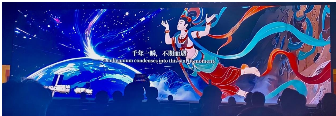
Zdjęcie 2. Ujęcie z filmiku "Soaring Dreams - From Mogao Caves to Space station".