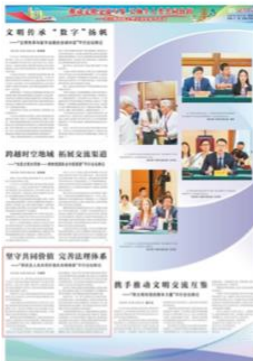
Zdjęcie 4: Zdjęcie 4. Artykuł o parallel session III w lokalnej gazecie.

Nasz udział w sesji zaowocował ciekawymi przemyśleniami na temat obecnego systemu prawnego, który wymaga uaktualnienia do potrzeb naszej ery. Uczestniczyliśmy także w dyskusji z lokalnymi mediami – nasza delegacja udzieliła wywiadu agencji prasowej Xinhua News Agency na temat znaczenia zachowania dziedzictwa Jedwabnego Szlaku i roli wymiany kulturowej. Świadczy to o rosnącym zainteresowaniu Stowarzyszeniem Dom Polski ze strony chińskich władz i mediów.