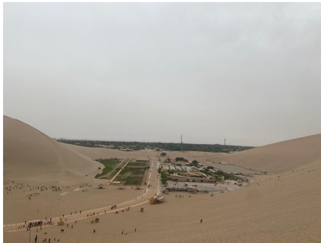
Zdjęcie 8. Widok na Oazę Crescent Lake.

miejsca. Imponująca scenografia, wsparta najnowocześniejszymi technologiami – takimi jak holograficzne projekcje i efekty 3D – oraz znakomite przygotowanie aktorów sprawiły, że widzowie mogli poczuć się niemal jak w starożytnym Dunhuang.